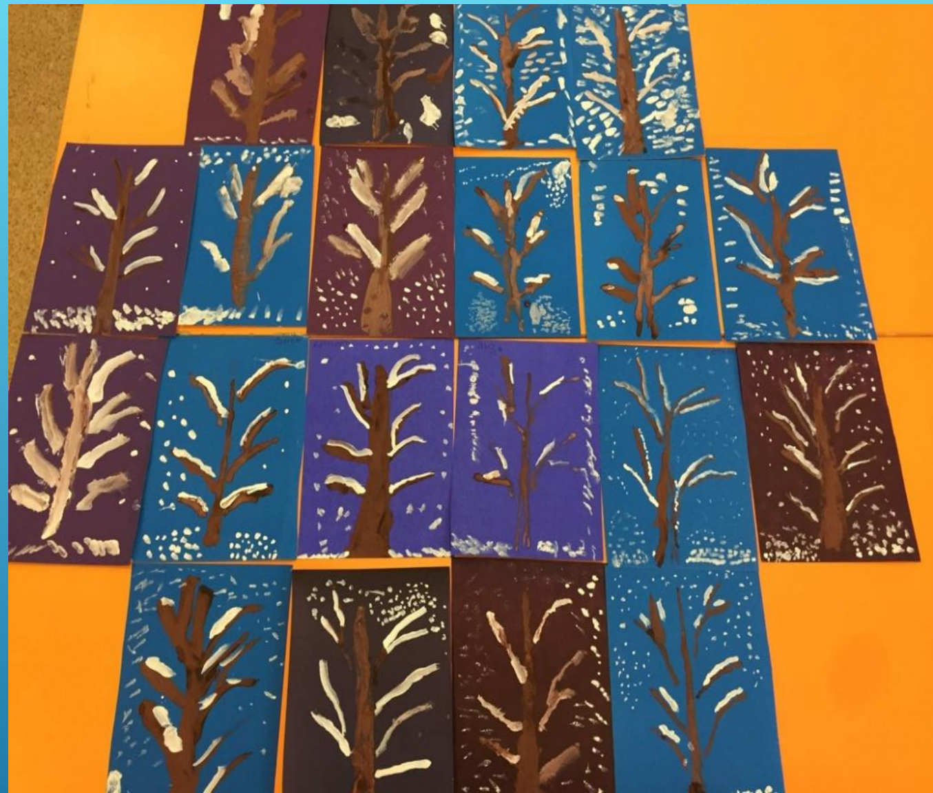
Рисование «Зимнее дерево»

И НЕ ДЛЯ КОГО НИ СЕКРЕТ, ЧТО МАЛЫШАМ СЛОЖНЕЕ ВСЕГО ЖДАТЬ, А ТЕМ БОЛЕЕ ЖДАТЬ ПРАЗДНИКА. ПОЭТОМУ, ОДНОЙ ИЗ ЗАДАЧ БЫЛО СДЕЛАТЬ ЭТО ОЖИДАНИЕ ВЕСЕЛЫМ, ПРИЯТНЫМ И ПОЛЕЗНЫМ ДЛЯ ДЕТЕЙ, А ТАК ЖЕ УЗНАТЬ ИСТОРИЮ ЭТОГО ЗАМЕЧАТЕЛЬНОГО ПРАЗДНИКА.