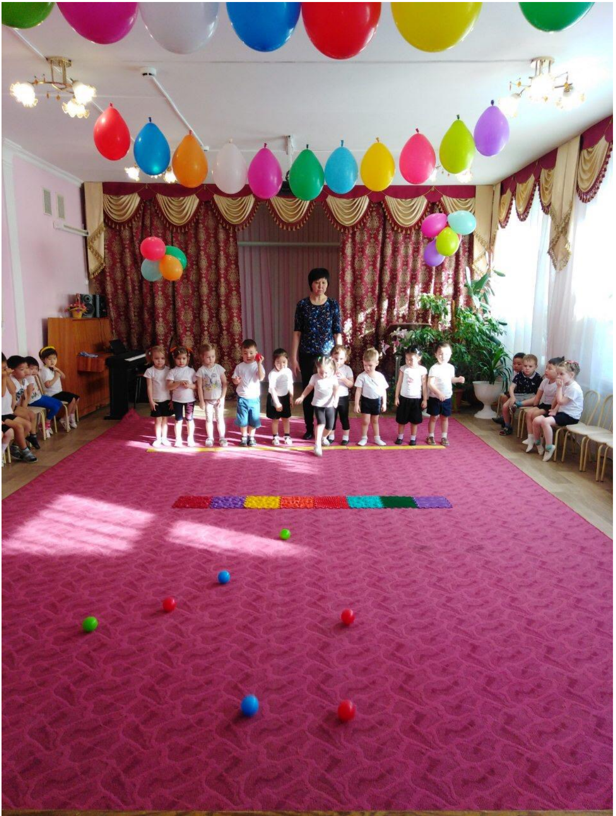
Воспитатель 2 Задание «Башня».