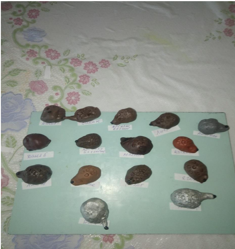
Лепка «Вот ежик не головы, не ножек.»

Самостоятельная деятельность в изо уголке