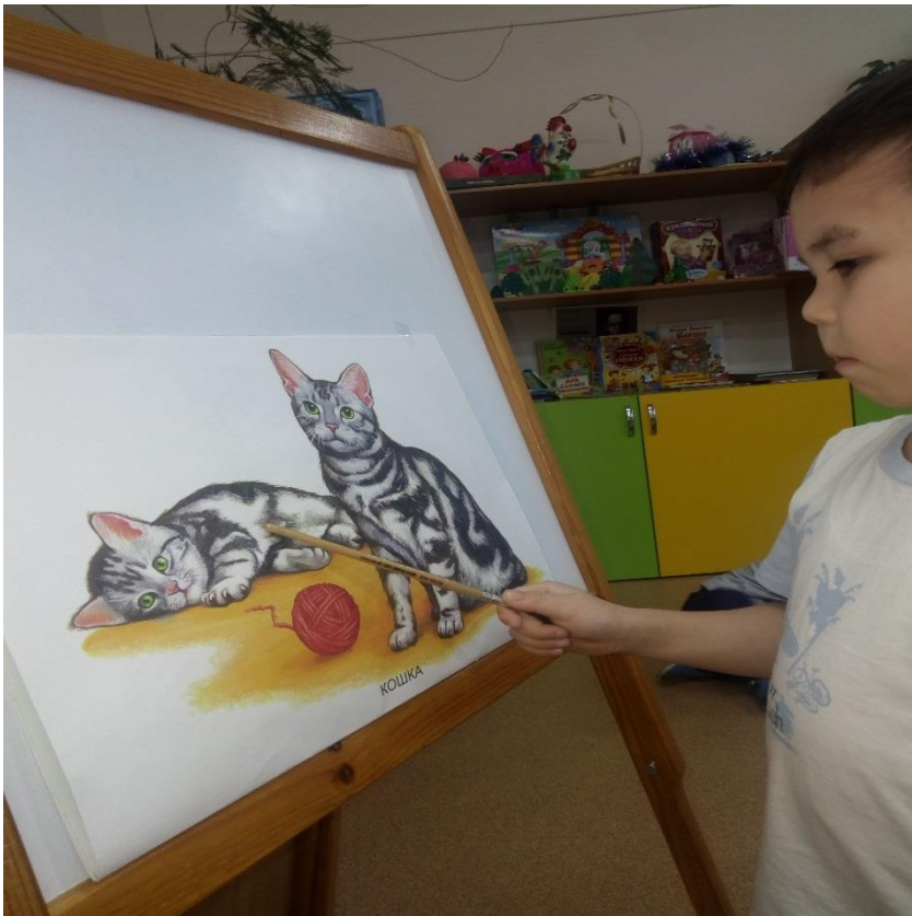
Составление рассказов по картинкам с изображениями героев